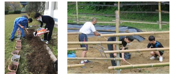
SNP(佐久間自然保護部)