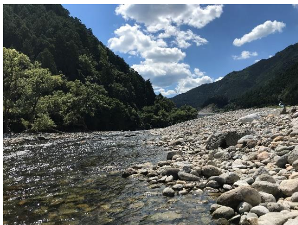
学校の近くを流れる天竜川