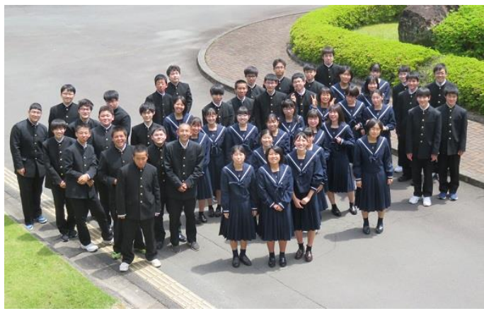
全校生徒(令和3年度)